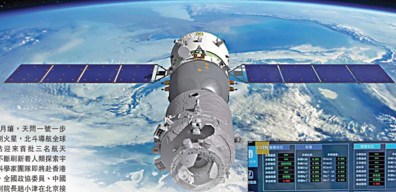
▲圖為神舟十二號飛船飛行模擬圖。