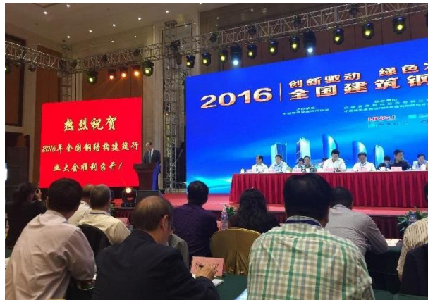
中金协会会长郝际平教授为大会致开幕