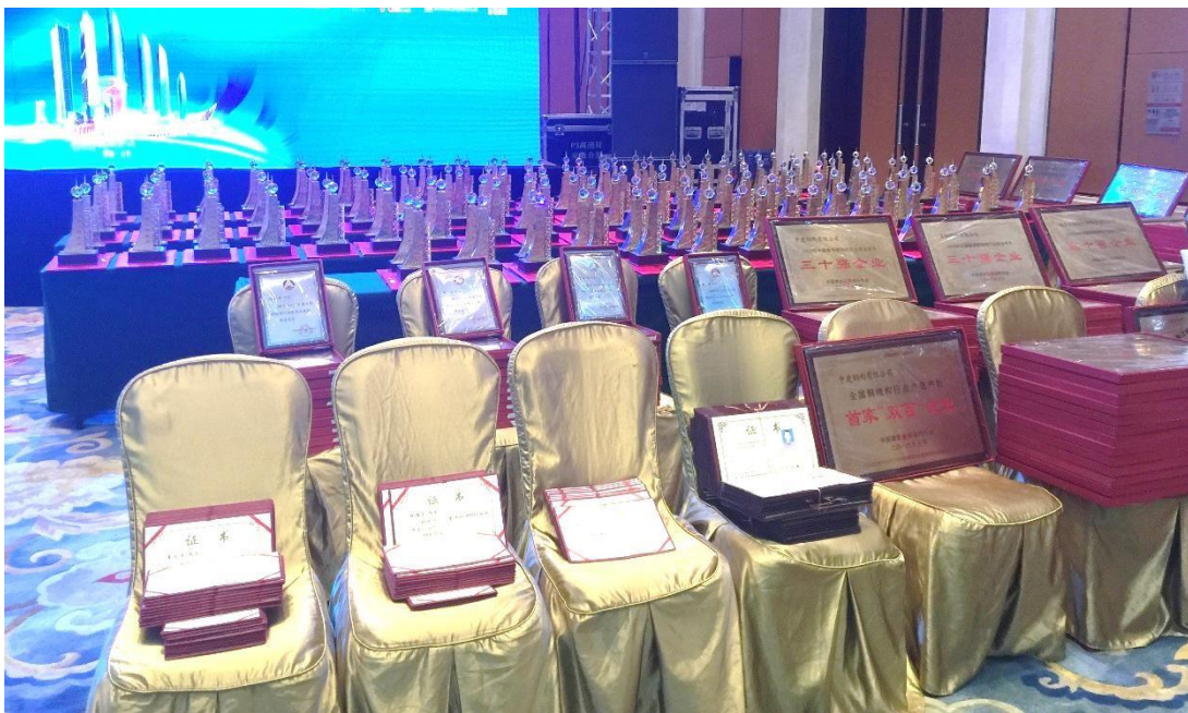
2016 年中国钢结构金奖的奖座及证书

大会的重要仪式之一为颁发 2016 年中国钢结构金奖，当中奖项包括第十二届（第一批）“中国钢结构金奖”获奖工程及企业、“中国建筑钢结构诚信企业”、全国钢结构行业综合实力“百强”、建筑工程施工总承包试点先进企业、“中国建筑金属屋（墙）面十强企业”，优秀企业家、优秀工作者、优秀建造师、优秀车间主任、优秀通讯员等。