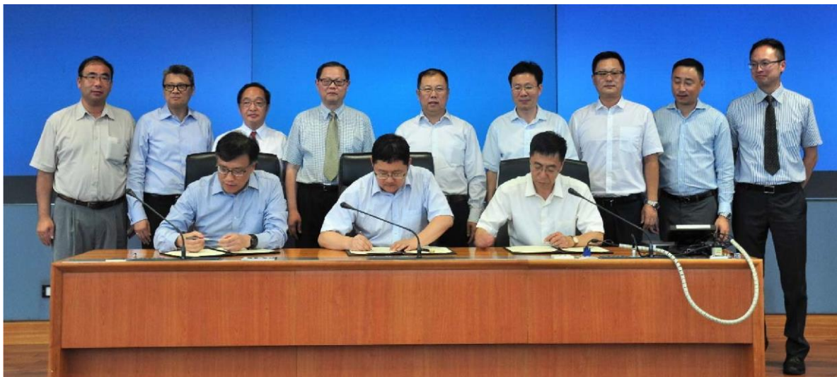
三方领导在各单位代表见证下签署工作备忘录

此工作备忘录合作项目同时得到中国钢铁工业协会、清华大学、北京科技大学、香港建筑金属结构协会和澳门金属结构协会的鼎力支持。