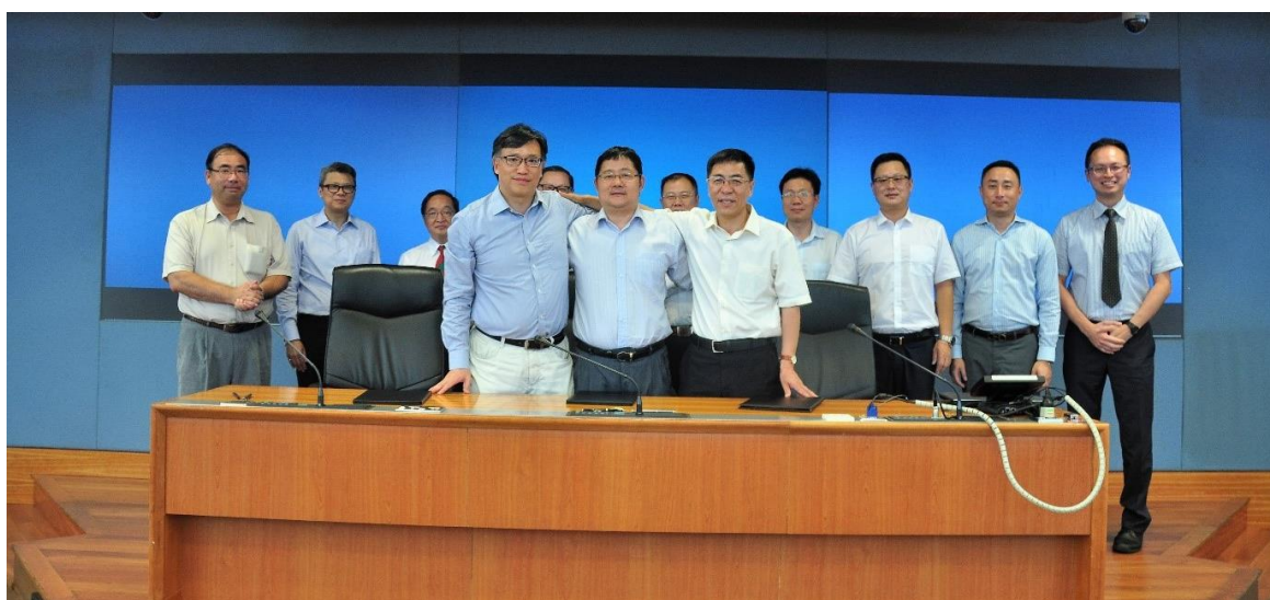
三方领导及各单位代表合照留念

此工作备忘录合作项目同时得到中国钢铁工业协会、清华大学、北京科技大学、香港建筑金属结构协会和澳门金属结构协会的鼎力支持。