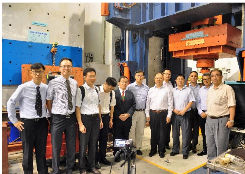
领导及各单位代表参观香港分中心结构工程实验室