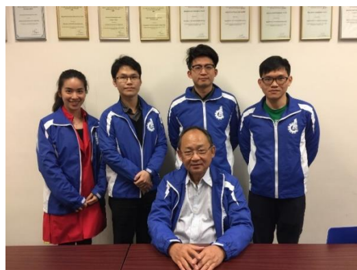
S. Kitipornchai 教授与在读博士生 (2017 年 3 月 7 日)

我们谨代表香港分中心对 S. Kitipornchai 教授的宝贵意见表示诚挚的感谢。