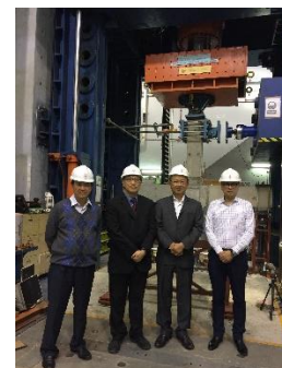
S. Kitipornchai 教授参观结构工程实验室（2017 年 3 月 6 日）