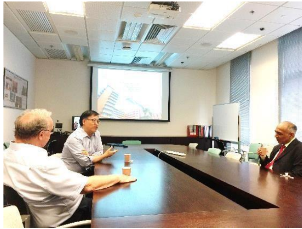
具成果的意见交流