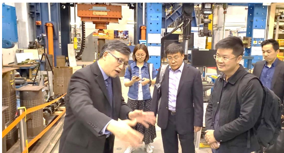
參觀香港理工大學結構工程研究實驗室