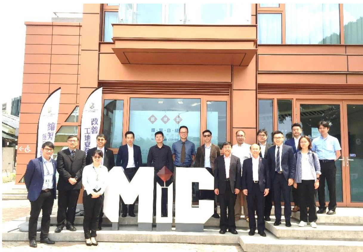
参观建造业议会的组建城