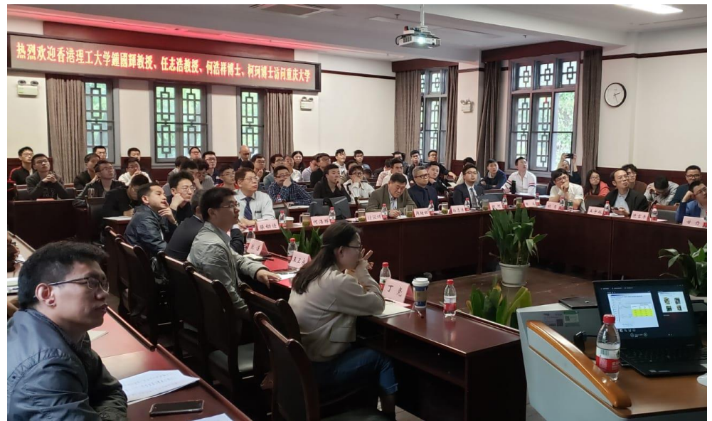
高强高效钢结构学术报告会