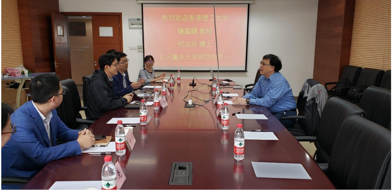
5 月 8 日早上的小组讨论及学术交流