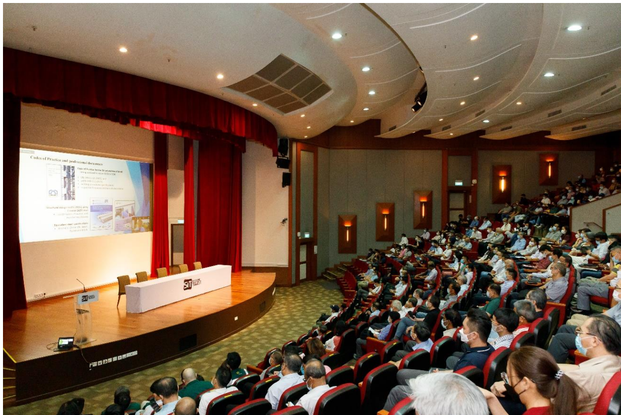
锺教授远程向新加坡理工大学的听众发表在线演讲

2022年7月13日，香港分中心主任锺国辉教授应邀为新加坡理工大学建筑技术创新实验室主办的「CTIL 可持续建筑的高性能钢材和混凝土材料」技术研讨会作主讲嘉宾，进行了在线演讲。锺教授的演讲题目是「高强度 S690 钢在建筑中的有效使用及其对焊接后机械性能的影响」。技术研讨会由新加坡理工大学技术创新实验室主任及集群总监周诚彬教授组织和主持。