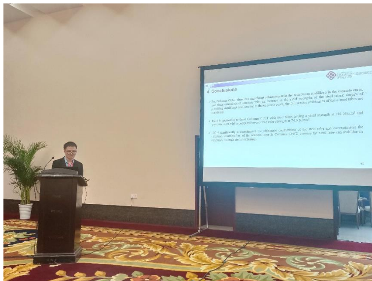
门朋飞博士主题汇报：《圆形钢管混凝土短柱轴压性能试验研究》