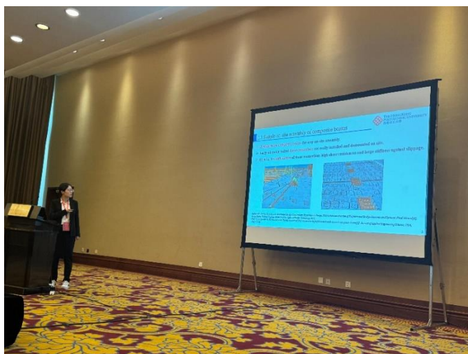
丁艳主题汇报：《装配式组合梁中大直径螺栓剪力连接件的结构性能研究》

10月29日上午，分中心主任钟国辉教授、常务副秘书长何浩祥博士、助理教授（研究）胡亦非博士出席了2023中国钢结构大会暨中国钢结构协会第八届六次理事会。中国钢结构协会常务副会长刘毅主持大会开幕式，并由会长岳清瑞院士作工作报告，回顾和总结了协会2023年的工作，并立足行业高质量发展，提出了2024年协会的工作思路和发展目标。