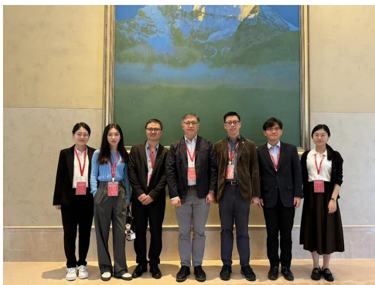
分中心参会代表合影留念