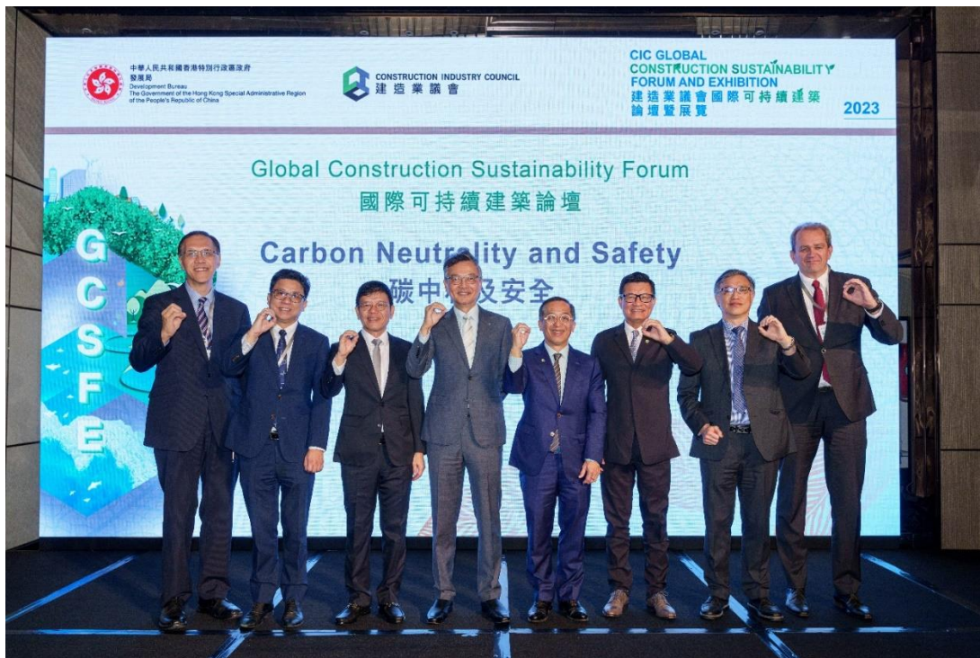
碳中和与安全论坛开幕式合影

「国际可持续建筑论坛暨展览 2023」是香港首个建筑可持续发展大型活动，旨在解决建筑行业的可持续发展问题，包括展览、论坛、颁奖典礼、章程签署仪式和技术参观等活动。这些活动旨在连接行业转型的各个方面，并促进数字化创新、跨境和跨部门合作以及 ESG（环境、社会和治理）领域的发展。开幕典礼于 2023 年 11 月 20 日由发展局局长林文纳黛女士主礼，并由建造业议会主席何绍康工程师致欢迎辞。