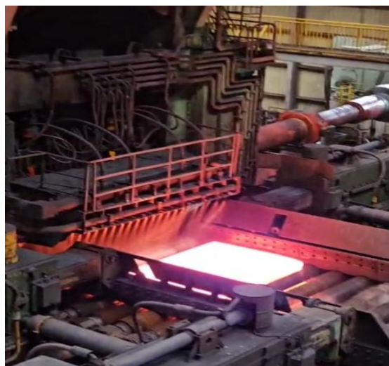
考察山东钢铁集团日照有限公司，了解高强钢的生产技术