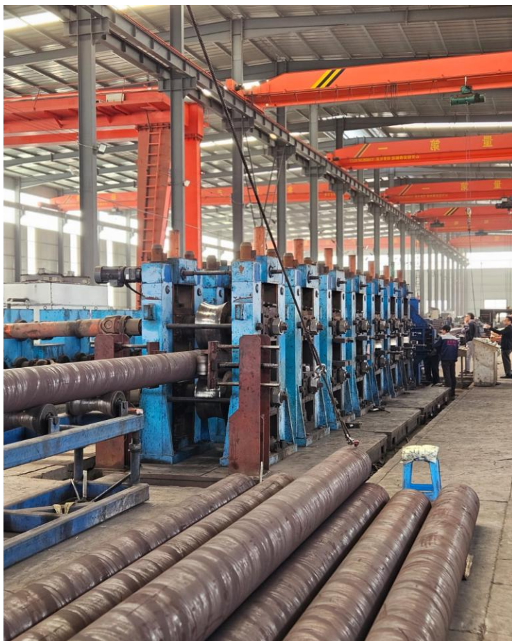
到华峰首秦冶金科技有限公司考察，了解欧标高强钢管的生产技术