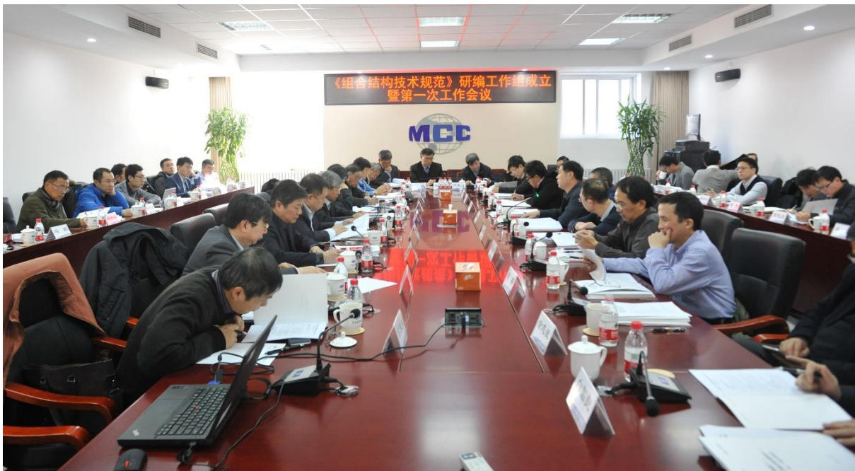
编制组成立暨第一次工作会议