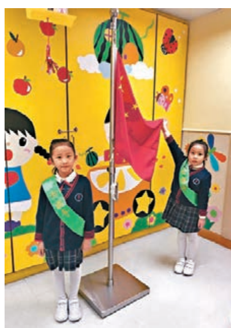
■兩位學生懸掛國旗有板有眼。

旗及懸掛國旗的方法、升旗儀式的步驟，及其他需要注意的事項等，然後返回學校教導學生，共有超過430位校長、副校長、主任或老師出席，反應