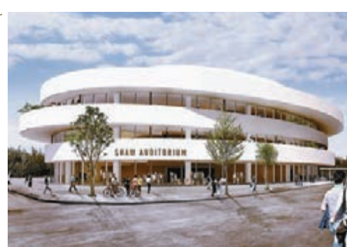
■逸夫演藝中心的設計構想圖。Henning Larsen Architect Hong Kong 供圖

熱烈。有關計劃及工作坊的詳情，可瀏覽中心網頁： https://endeavour.org.hk/index.php/china-nowday/gjc-1