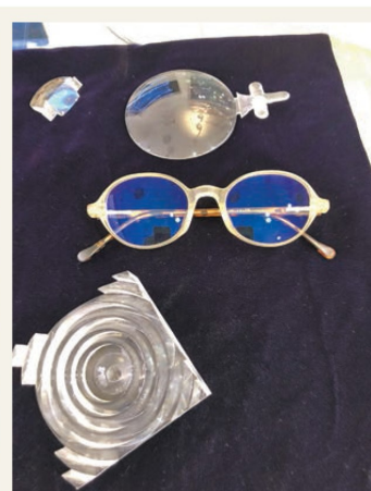
精心拋光的鏡片，「沒有最好，只有更好」，致力追求更理想效果。