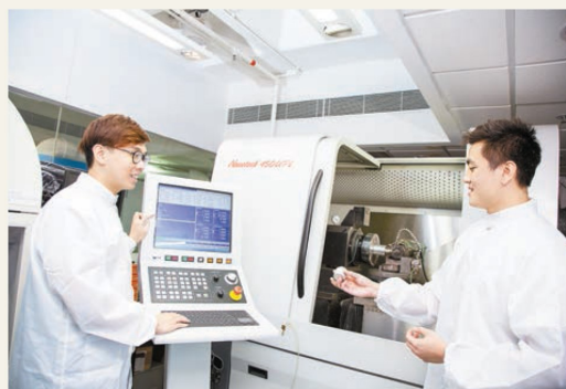
實驗室人員操作精密設備以研製不同規格的产品。