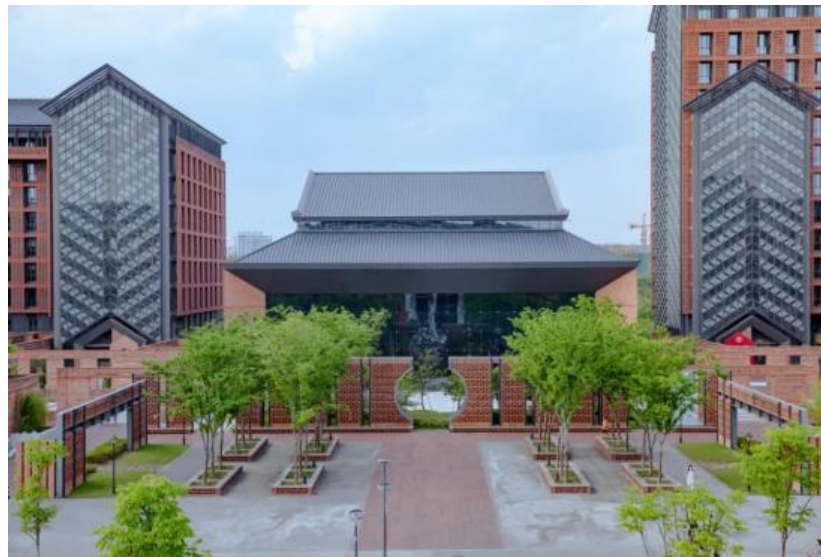
浙江大學紫金港校區