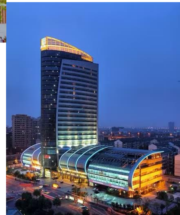
2023年暑期入住杭州百瑞運河大酒店（准五星）